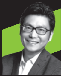
董本洪 阿里巴巴集团 首席市场官