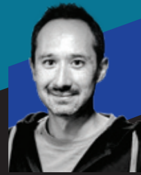
Sébastien Borget The Sandbox 营运总监兼联合创始人