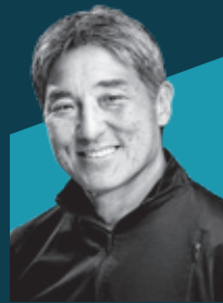
盖伊·川崎先生 Canva 首席宣传官