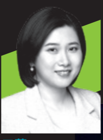
三藏 哔哩哔哩 营销中心营销企划负责人