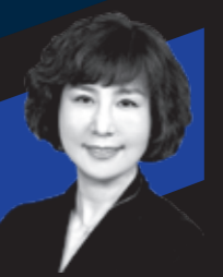
金昱冬 Visa 亚太区高级副总裁 兼市场营销主管